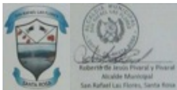
Roberto de Jesús Pivaral y Pivaral, Alcalde Municipal Municipio de San Rafael las Flores,