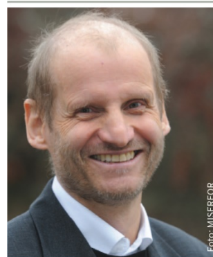
Pfr. Pirmin Spiegel, MISEREOR

Un año después de la publicación de la encíclica Laudato Si' , desde Misereor podemos decir que el Papa Francisco ha hecho una muy buena jugada. Ha sorprendido tanto dentro como fuera de la Iglesia y del mundo de la religión; traspasando fronteras religiosas e ideológicas, ha puesto sobre la mesa del debate político y social urgentes temas de la humanidad y ha influido en la agenda política internacional sobre las grandes cuestiones que afectan a nuestro futuro: cuestiones como cómo superar la pobreza mundial en un mundo hipereconomizado, cómo alcanzar formas sostenibles de alimentación, cómo limitar el cambio climático provocado por el ser humano, cómo garantizar una vida digna en el entorno rural y en las ciudades en expansión. El momento de su publicación se eligió conscientemente para que fuera justo antes de las grandes conferencias de la comunidad internacional: en septiembre de 2015 se debatieron los retos globales de la Agenda 2030 y los Objetivos de Desarrollo Sostenible, y en diciembre de 2015, la Cumbre del Clima de París. Y para octubre de 2016 está prevista la conferencia de las Naciones Unidas sobre la vida en las ciudades del mundo. Ahora se trata de conseguir poner en práctica el acuerdo de la forma más ambiciosa posible, aunque el resultado es incierto. ¿Cómo podría conseguirse?